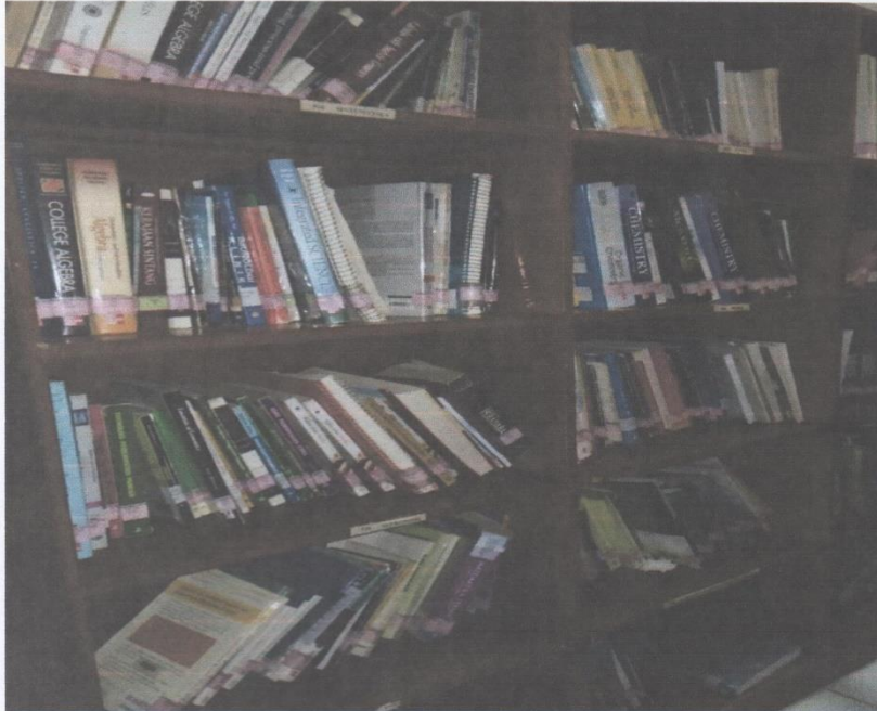
Gambar 1. Kondisi Koleksi di Sirkulasi