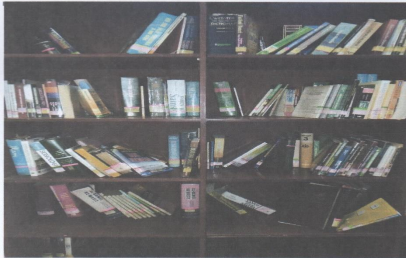
Gambar 2. Kondisi Koleksi di Ruang Referensi