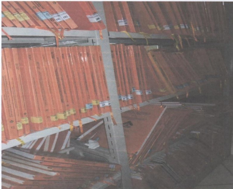
Gambar 3. Kondisi Koleksi di Ruang Local Content dan Tandon