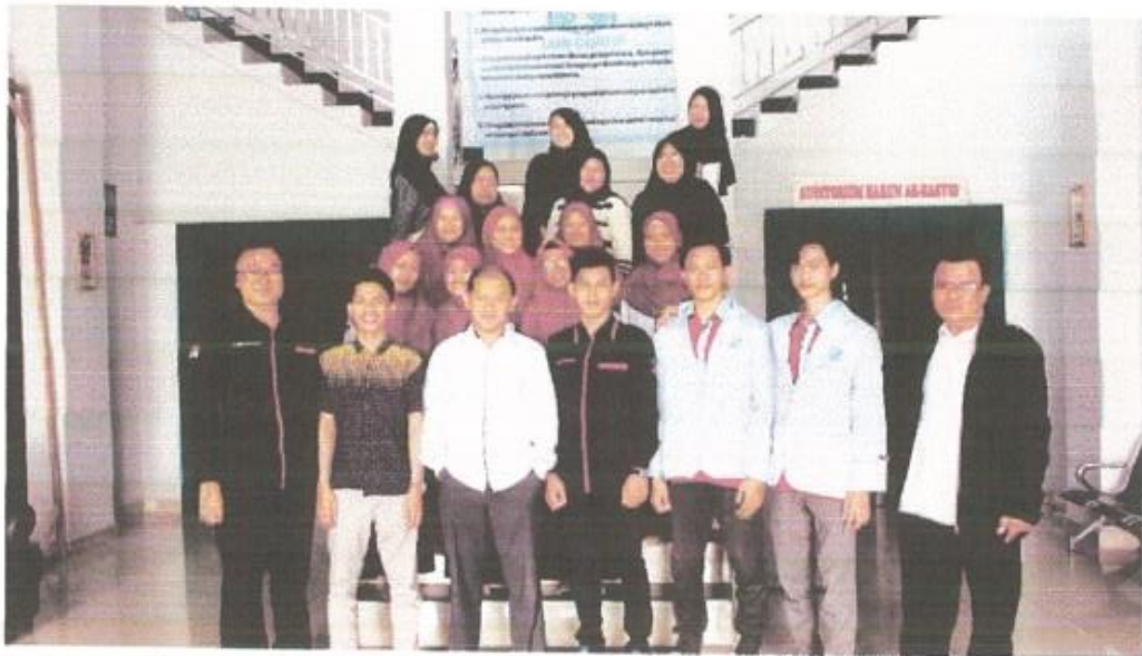
Foto Bersama Pemustaka Ketika Mengisi Angket Penelitian