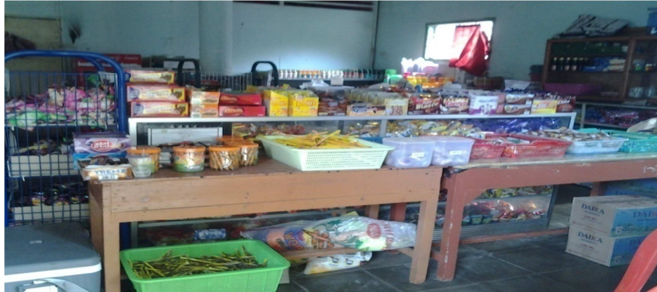
Gambar 1 Keadaan dalam Koperasi Pesantren 50

Pengisi koperasi ini 30 % dari masyarakat sekitar 70 % nya modal pesantren sendiri.