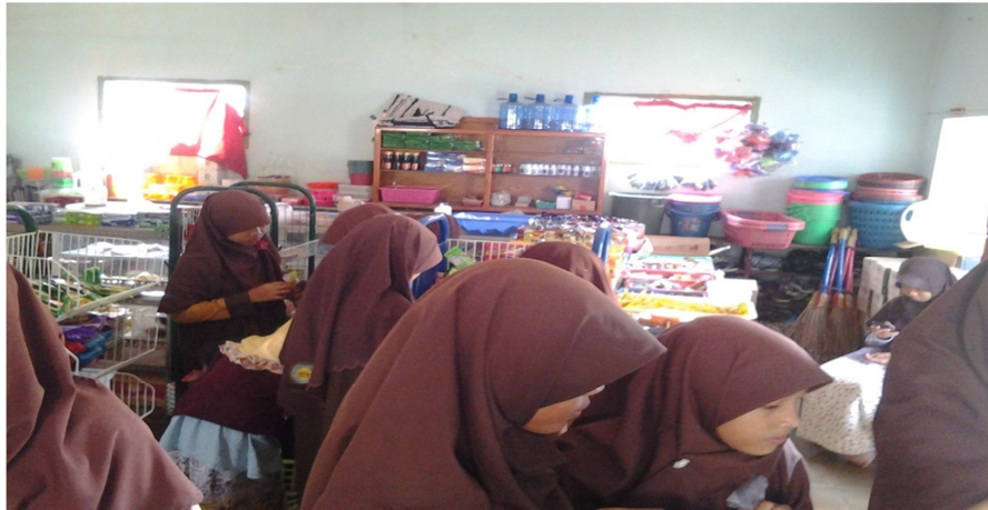
Gambar 3 Para santri memadati Koperasi saat jam istirahat 52

Berdasarkan hasil wawancara lain dengan Masyarakat bernama Mihilah/ 44 tahun. Pada tanggal 2 Maret 2015 di Pesantren Raudhatul Ulum Sakatiga. Menurutnya peran koperasi dan bagian-bagian badan usaha lainnya sangat membantu mereka guna mencukupi kebutuhan sehari-hari dan biaya pendidikan anak. Semakin banyak permintaan konsumen dalam artian semakin banyaknya pelajar semakin meningkat pendapatan mereka. Salah satu kendala juga yaitu biaya sewa yang sekiranya bisa diperkecil lagi. Namun jika itu memang sudah menjadi ketetapan juga harus disyukiri,Ujarnya.