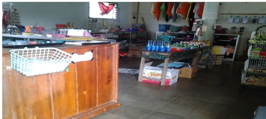
Gambar 2 perlengkapan Santri yang ada di Koperasi 51