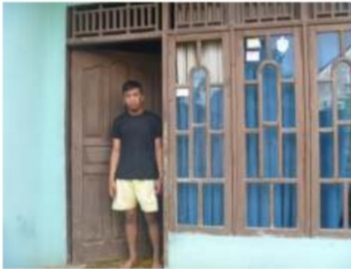
Gambar 7. Salah satu Anak Putus Sekolah di Kota Palembang

membuat Budi mencari kebahagiaannya sendiri di luar rumah. Akhirnya kondisi lingkungan sosial yang buruk menyebabkan Budi tidak melanjutkan ke SLTA bahkan terjerumus pada narkoba. Seperti halnya Andi, saat ini Budi banyak menghabiskan waktunya untuk bermain-main saja tanpa masa depan yang jelas.