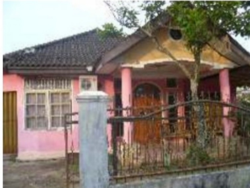
Gambar 5. Rumah Salah Satu Anak Putus Sekolah di Kota Palembang