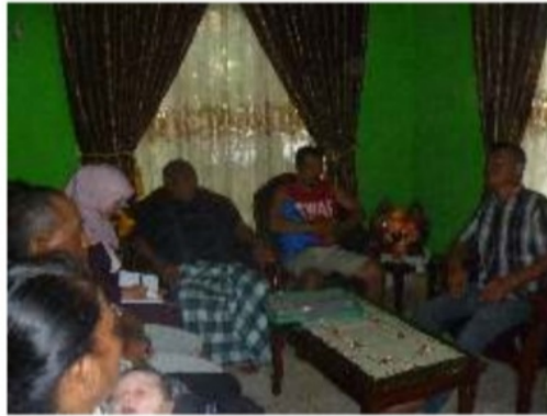
Gambar 4. Focus Group Discussion dengan Tokoh Masyarakat Rt. 22 Kelurahan Srijaya Palembang

upaya mencari penghasilan guna memenuhi kebutuhan keluarga dan mengabaikan perhatian pada pendidikan anak-anak mereka.