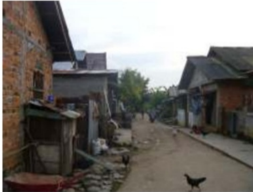
Gambar 6. Lingkungan Tempat Tinggal Anak Putus Sekolah di Kota Palembang

Selain faktor kemiskinan, menurut para tetangga sebenarnya Andi sendiri juga merasa kurang mampu mengikuti pelajaran di SLTA yang dianggap “berat”. Saat ini Andi banyak menghabiskan waktunya dengan bermain-main atau sesekali ikut ayahnya menjadi buruh bangunan. Memang ada keinginan orang tua agar Andi dapat melanjutkan lagi sekolahnya. Akan tetapi justru Andi yang saat ini sudah tidak ingin lagi bersekolah karena sudah merasakan dapat memperoleh uang sendiri dan membeli keperluan pribadi sendiri dengan uang tersebut tanpa harus meminta pada orang tua yang belum tentu akan selalu memberi.