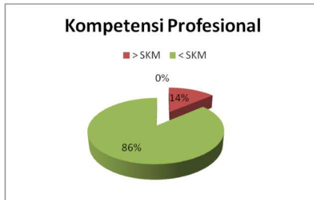
Gambar 5. Kompetensi Profesional Guru SD di Kabupaten Banyuasin