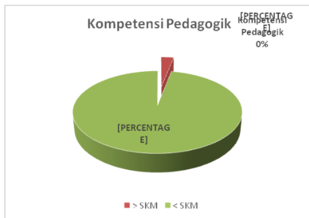
Gambar 3. Kompetensi Pedagogik Guru SD di Kabupaten Banyuasin

dengan guru yang memiliki kompetensi pedagogik > SKM. Dalam bentuk grafik, gambaran kompetensi pedagogik guru SD di Kabupaten Banyuasin disajikan pada gambar 3.