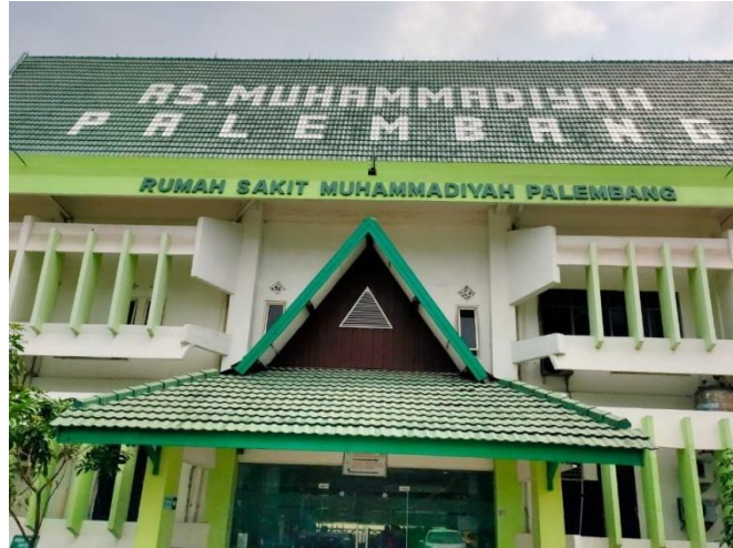
Gambar 2 : RS Muhammadiyah Palembang