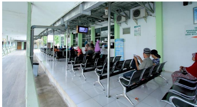
Gambar 3 : Apotek RS Muhammadiyah Palembang