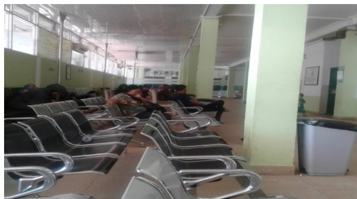
Gambar 4 : Ruang tunggu Poli rawat jalan