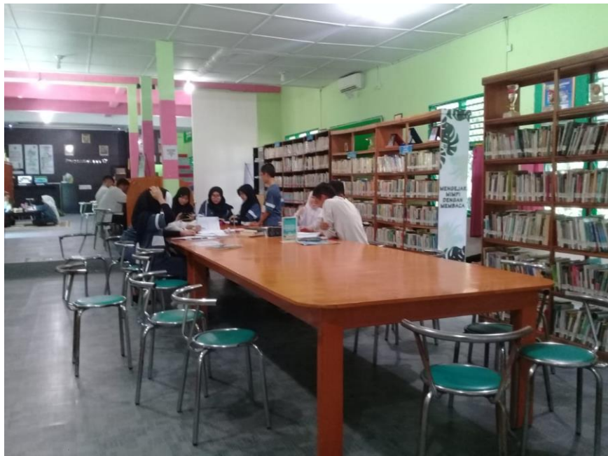
Foto Siswa Berdiskusi Saat Belajar