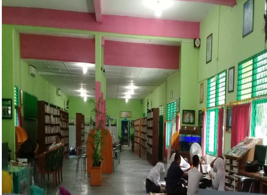
Foto Suasana Pembinaan Intensif OSN di Perpustakaan