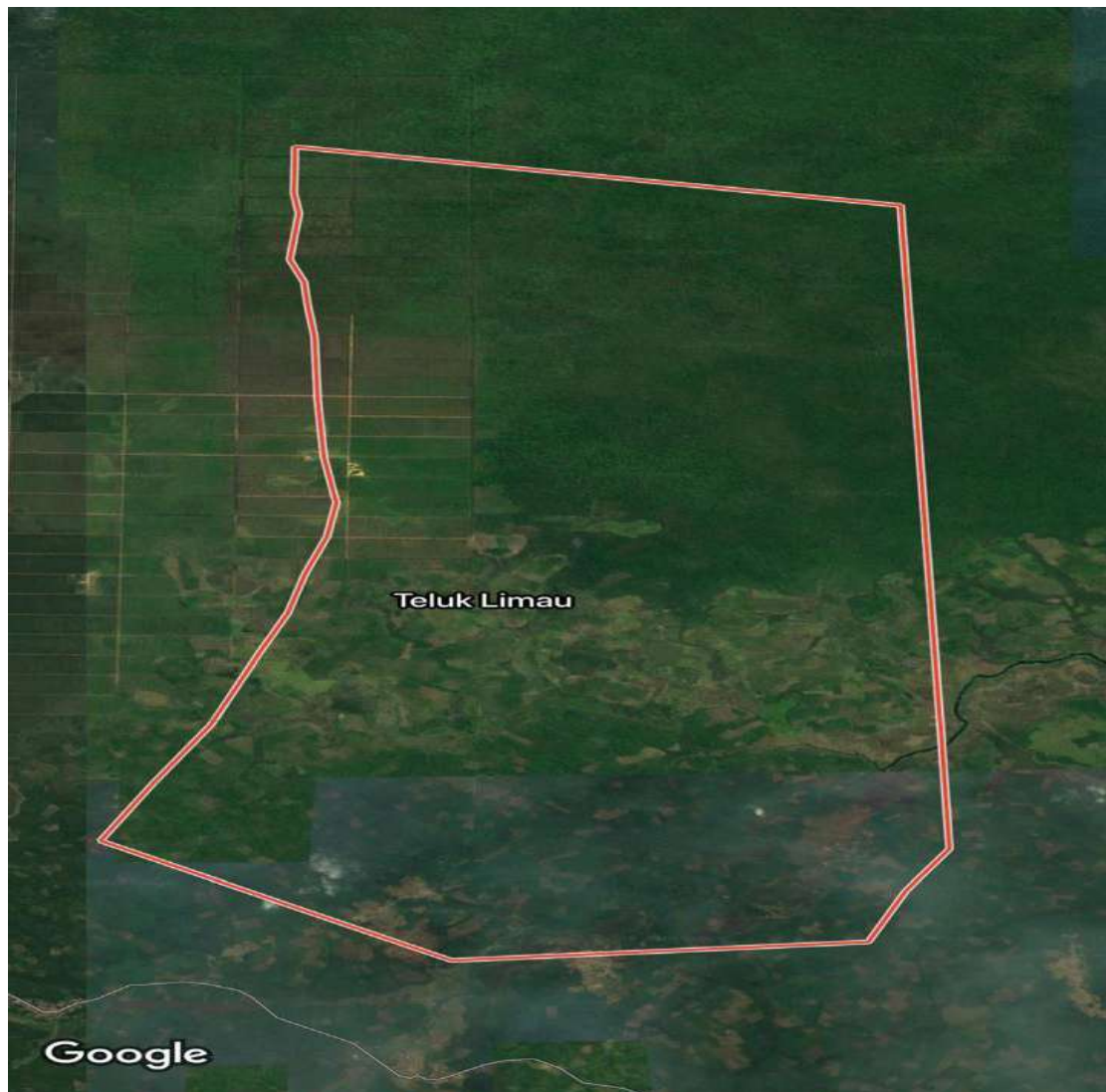
Gambar 1. Desa Teluk Limau kecamatan Gelumbang kabupaten Muara Enim.

Jarak antara Desa Teluk Limau dengan Ibukota Kecamatan Gelumbang yaitu 20 km. Sedangkan ibukota Kabupaten berjarak 82 km. untuk mencapai Ibukota Kecamatan dan Ibukota Kabupaten dapat ditempuh dengan kendaraan sepeda motor dan mobil. Adapun waktu tempuh dari Desa Teluk Limau ke ibukota Kecamatan ditempuh selama 30 menit sedangkan untuk ke ibukota Kabupaten ditempuh selama 4 jam.