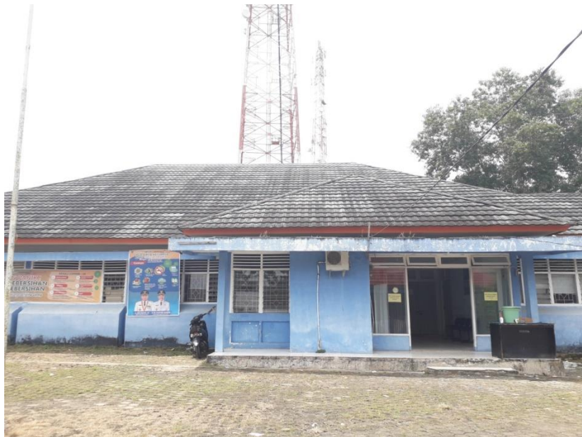
Gambar II Kantor Camat Kecamatan Pampangan Kabupaten Ogan Komereng Ilir