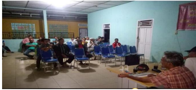
Kegiatan dalam pembentukan panitia yang diketuai oleh bapak keman di balai Desa Air Lintang