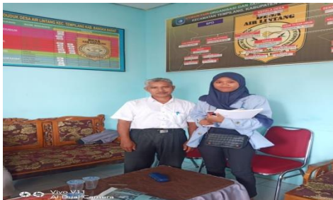
Kantor Kepala Desa dan data penduduk Air Lintang Kecamatan Tempilang