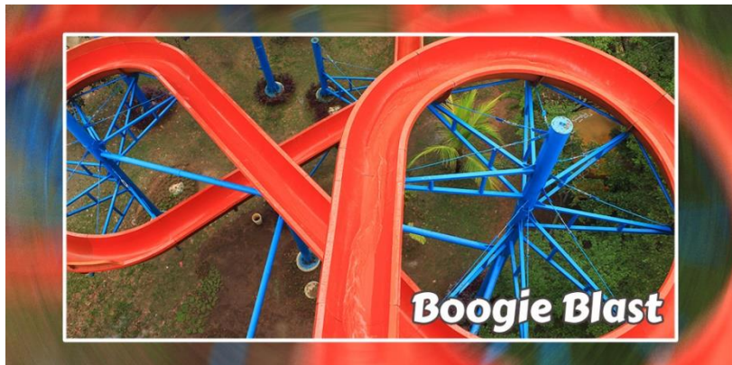
Gambar 3.11 Boogie Blast

Wahana ini juga tidak menggunakan ban dan berada satu tower dengan yang lainnya.