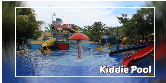
Gambar 3.3 Kiddie Pool

Dengan dibuat secara realistis dan mendalami konsep permainan seluncuran kecil maupun ember raksasa, Kiddie Pool merupakan kolam yang disukai dan dikhususkan untuk anak-anak. Di area tersebut terdapat berbagai macam wahana untuk anak-anak. Dengan kedalaman kolam yang mencapai tidak lebih dari 50 cm ini menjadikan area yang aman untuk anak-anak bermain. Walaupun dikhususkan untuk anak-anak, tetapi orang dewasa juga bisa menikmati area ini.