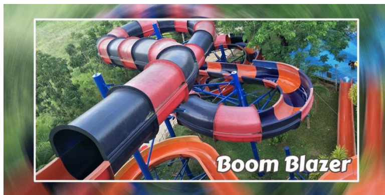
Gambar 3.9 Boom Blazer

Wahana ini berada di satu tower dengan Twister Cone . Yang membedakannya jalur dari wahana ini melingkar seperti ular. Hal itu diperuntukkan untuk menambah sensasi adrenalin yang seru. Wahana ini juga harus menggunakan ban dan memenuhi kriteria tinggi dan berat badan serta bebas dari segala penyakit terutama penyakit jantung.