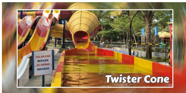
Gambar 3.8 Twister Cone