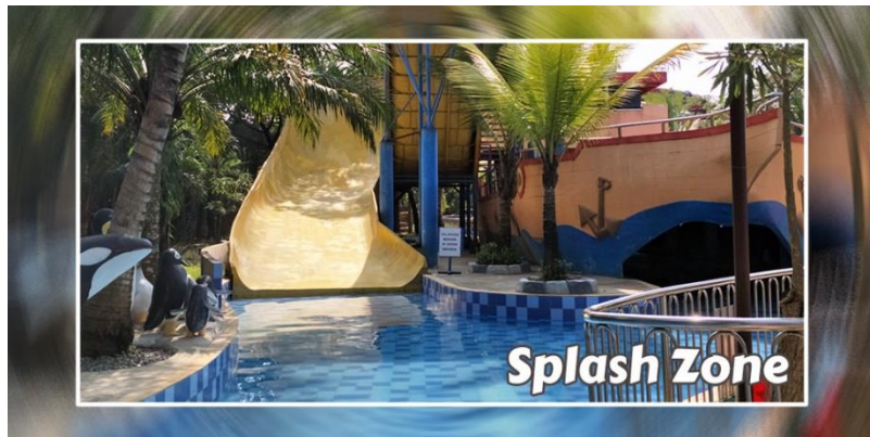
Gambar 3.7 Splash Zone

Splash Zone seperti namanya yaitu merupakan zona percikan atau geyser. Wahana ini berada di atas bangunan kapal besar. Setelah meluncur dari atas, langsung dibawa mengalir di adventure river . Untuk bisa menikmati wahana ini, pengunjung harus memenuhi kriteria tinggi dan berat badan yang direkomendasikan oleh pengelola yang diinstruksikan langsung oleh penjaga wahana tersebut. Karena wahana ini cukup ekstrim untuk dinikmati.