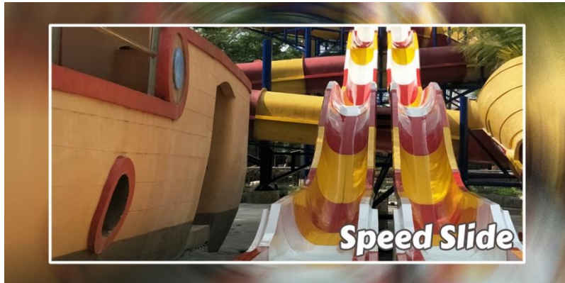
Gambar 3.10 Speed Slide

Wahana ini berada di tower tinggi. Sama seperti Boom Blazer dan Twister Cone . Dan tidak boleh menggunakan ban.