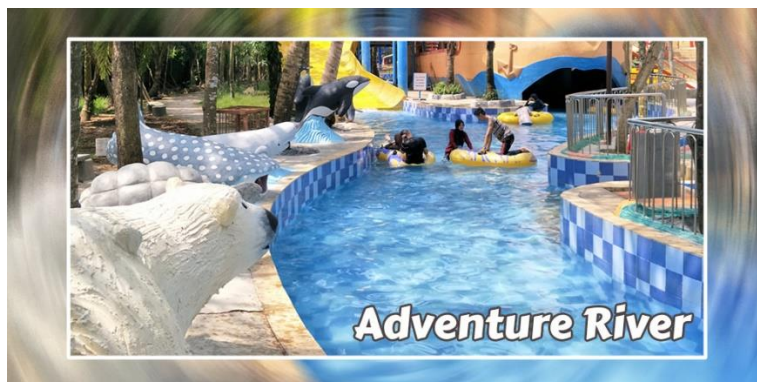
Gambar 3.5 Adventure River

Seperti namanya, kita akan dibawa bertualang mengelilingi wahana-wahana yang ada di dalam Opi Water Fun. Dengan konsep seperti sungai arus namun tidak deras,