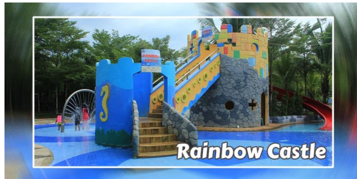
Gambar 3.4 Rainbow Castle

Dengan struktur bangunan yang dibuat mirip sebuah kastil berwarna pelangi, tentunya ini menjadi pusat perhatian bagi anak-anak. Area ini berada disebelah Kiddie Pool , tetapi kedalaman kolam ini sedikit lebih dalam dari kiddie pool . Anak-anak bisa bermain di area ini tetapi harus didampingi oleh orangtua.