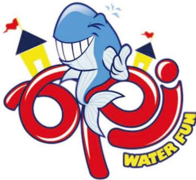
Gambar 3.1 Logo Opi Water Fun