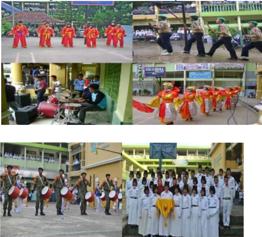
Gambar 4 Program Ekstrakurikuler SMA Muhammadiyah 1 Palembang

SMA Muhammadiyah 1 Palembang memiliki 17 cabang Ekstra kurikuler dengan masing-masing cabang dibina oleh guru dan memiliki pelatih