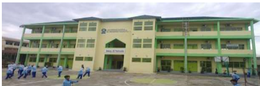
Gambar 3. Gedung A.R Fakhruddin