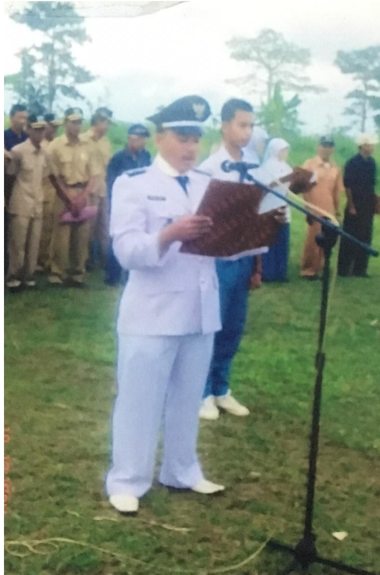
Gambar 2.1 kepala Desa Arisan Musi Timur Periode 2009-2014

Sumber: mantan Kepala Desa Arisan Musi Timur priode 1