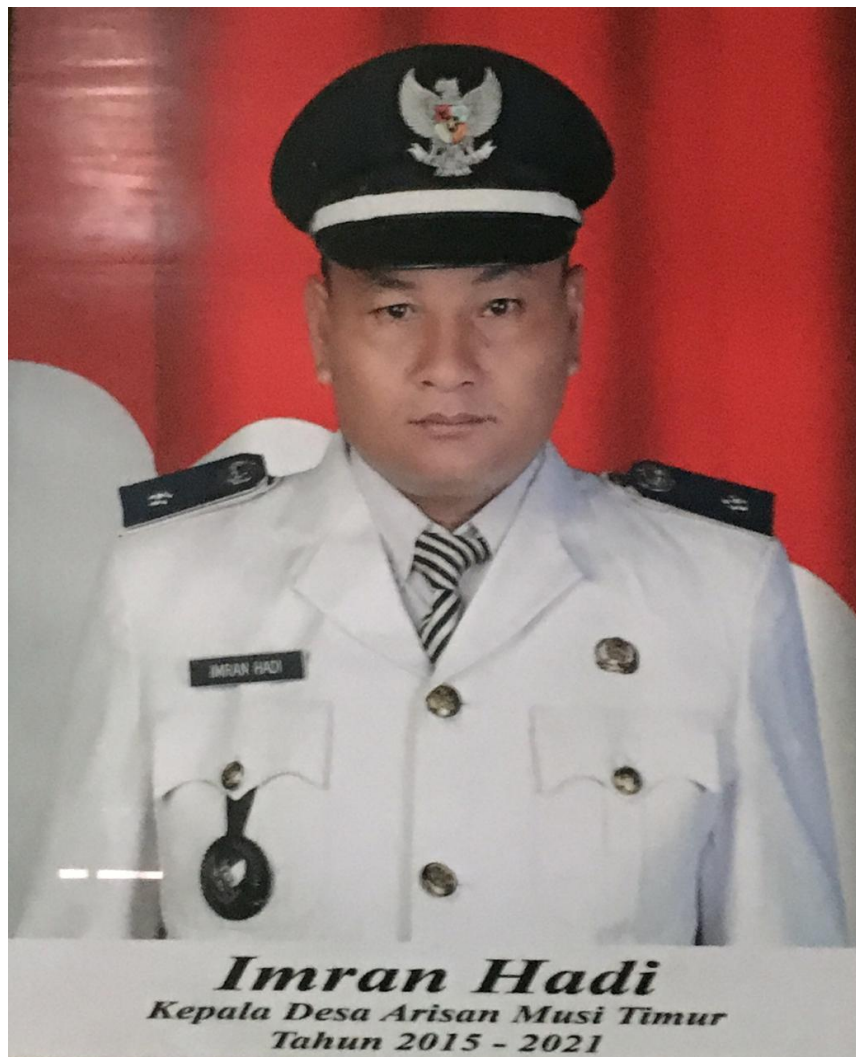
Gambar 2.2 Kepala Desa Arisan Musi Timur priode 2015 - 2021