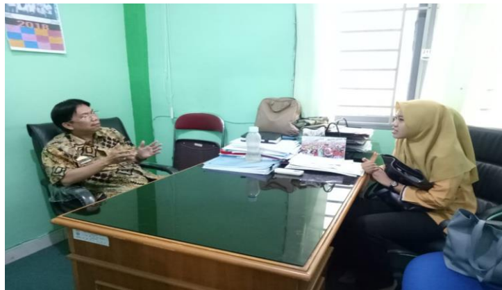
Wawancara dengan Kepala Dinas Perindustrian Kota Palembang