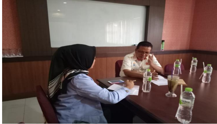
Wawancara dengan Ketua P3KPU ( Presidium Persiapan Pembentukan Kabupaten Palembang Ulu )